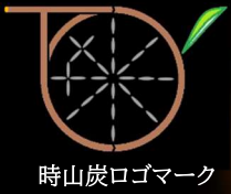
時山炭ロゴマーク