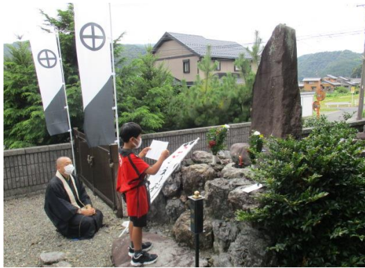
長寿院盛淳公の墓(琳光寺)