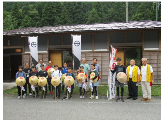
島津越え(時山地区・五僧峠前)