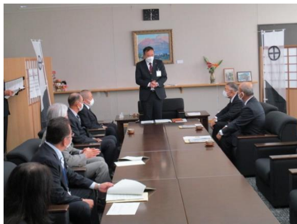
大垣市長表敬訪問(大垣市役所)