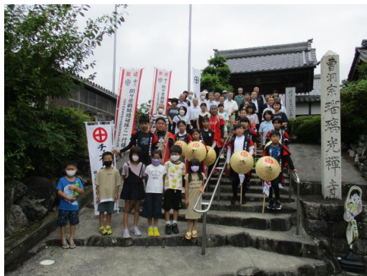
島津豊久公の菩提寺(瑠璃光寺)