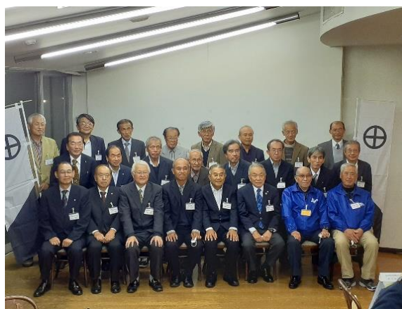
交流会(日本昭和音楽村・華ひびき)