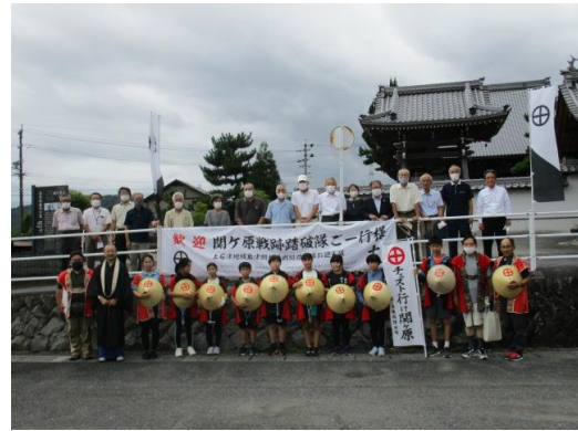
記念写真(牧田支所・琳光寺前)