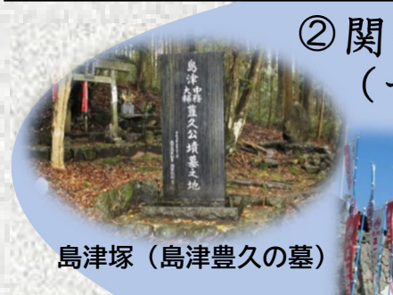
島津塚(島津豊久の墓)