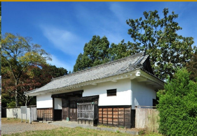
国史跡 西高木家陣屋跡（長屋門）