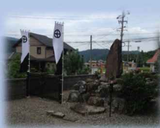
琳光寺 (阿多長寿院盛淳の墓)