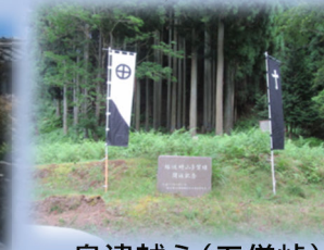
島津越え(五僧峠) [岐阜・滋賀県境]

②集合場所・時間 8:45 JR関ヶ原駅 9:00 上石津総合体育館 主な場所・時間 9:40 上石津郷土資料館 10:30 島津塚・瑠璃光寺 11:15 白拍子谷 11:45 緑の村公園(昼食) 12:45 延坂 13:25 島津越え(五僧峠) 14:15 時山文化伝承館 解散時間・場所 15:40 上石津総合体育館 16:00 JR関ヶ原駅