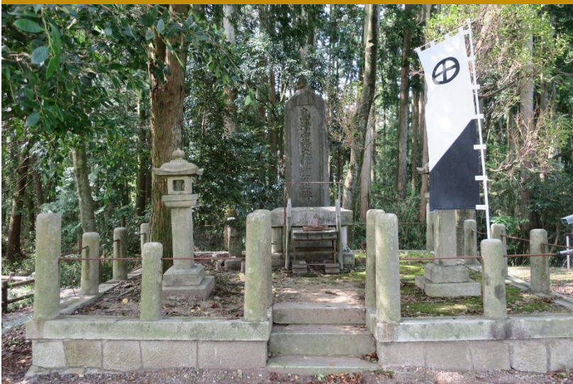
烏頭坂（島津豊久の碑）