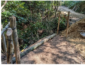
⑤次は木をここに集めます