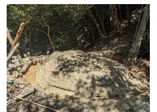
⑧むしろを敷き詰めます