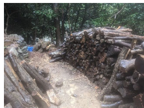
⑥集めた木を・・・