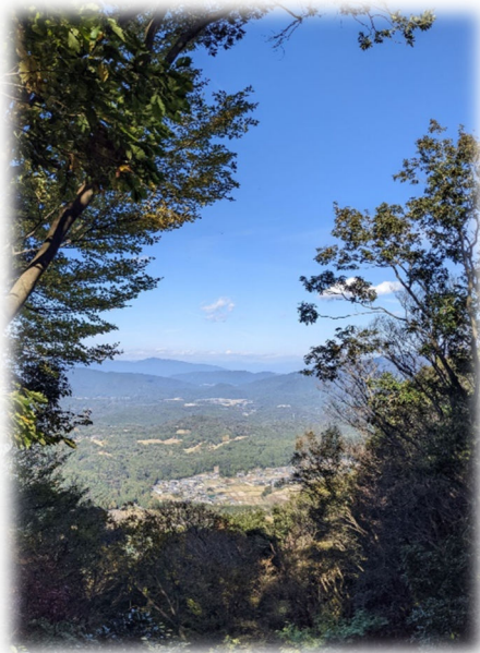
烏帽子岳から 令和4年秋

上石津に引っ越してから1年が経ちました！ 2年生です。終わってしまえば1年はとても早かったです。あと2年で卒業です。が、まだひとりでは、炭はつくれません。最初から3年間では時山炭の文化継承は難しいと思っていましたが、やっぱり難しそうです。