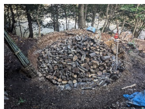
⑦このように炭窯に詰めます