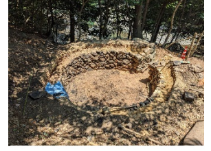
④積み終わりました！