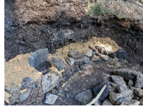
③改めて石を積んでいきます。