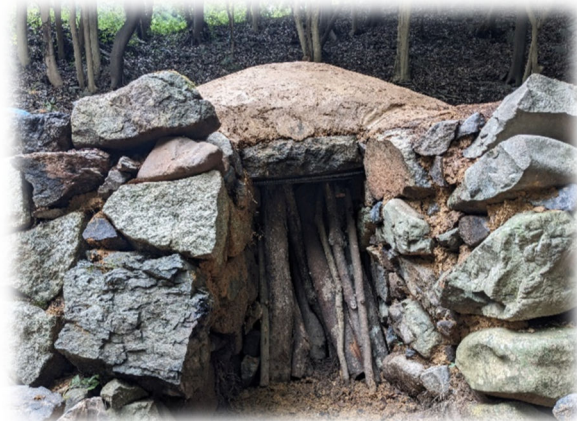
みんなで作った炭窯 乾いたら屋根を葺きます

炭窯ができれば安心かというそうでもなく、火を入れている間に天井が落ちることもあります。みんなで作った窯が丈夫であることを祈っています。 (裏面に炭窯づくりの特集があります)