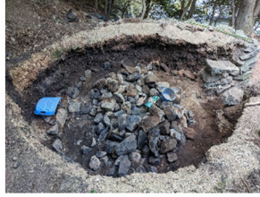
②積んであった石を外し