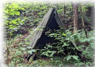
山の中にある炭窯跡