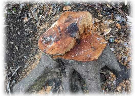
私が去年切った切株

チェーンソーを初めて触ってから半年が経ちますが、扱いはまだまだ不慣れで、怖さや不安があります。時山の木のようにじっくりゆっくり成長出来たらいいと思います。