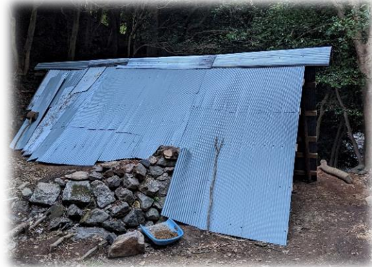
無事に炭窯ができました

炭窯を作るためにとてもたくさんの方からサポートして頂きました。本当にありがとうございます！初めての炭は10月2日(月)に出す予定です。とても楽しみです。