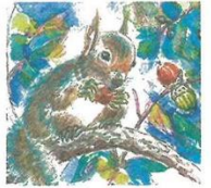
森のリス 無所属 稲垣久美子 (海津市南濃町)

大垣支局 〒503-0893 大垣市藤江町6-82-7 0584(78)2030 Fax(74)6460 養老通信局 0584(32)0699 Fax(32)2740 揖斐川通信部 0585(22)1150 Fax(22)0735