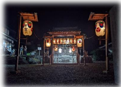
八幡神社正面から