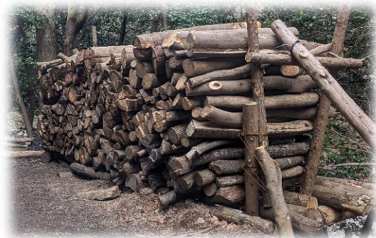
まだまだきれいな状態には積みません

木を伐ること、割ること、並べることなど、少しずつ成長している感じがします。まだまだですが経験を積み重ねて、体に染みこませたいです。