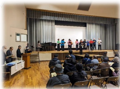
多良小学校校歌斉唱

2月23日(金・祝)24日(土)に多良地区の文化祭があり、出店しました。2度目の出店ということもあり、去年の文化祭よりも多くの方から、「よく来てくれたね」という声かけや支援の言葉をいただき、嬉しく思いました。