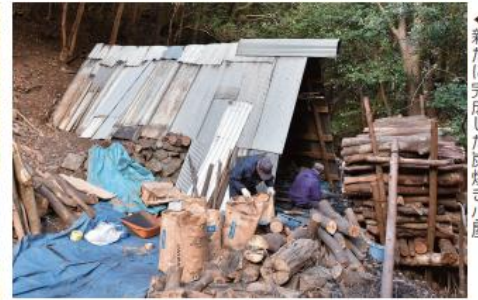
◀新たに完成した炭焼き小屋